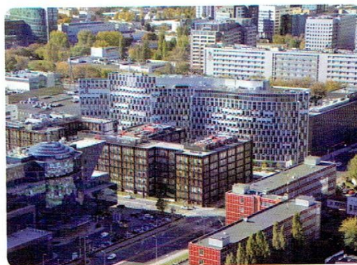
Obecnie Służewiec Przemysłowy jest dzielnicą biurową.