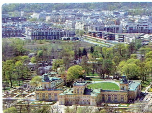
Dziś w Wilanowie widać przede wszystkim nowe osiedla mieszkaniowe o gęstej zabudowie.