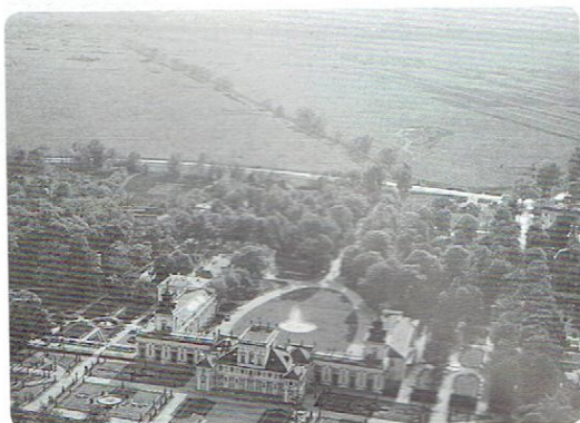
Na obrzeżach Warszawy, na przykład w Wilanowie, do niedawna przeważały pola uprawne.