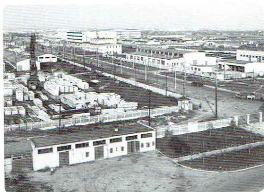
Na Służewcu Przemysłowym w Warszawie przez lata przeważały fabryki.

Krajobrazy naturalne od kilku tysięcy lat przekształcane są w krajobrazy kulturowe, od kiedy ludzie zaczęli uprawiać ziemię, wycinać lasy i budować osady. Aby łączyć ze sobą osady budowali drogi. Stopniowo krajobraz naturalny przenikał krajobraz kulturowy. Pod koniec XVIII wieku nastąpił gwałtowny rozwój przemysłu. Głównie na obszarach, gdzie wydobywano węgiel zaczęto budować kopalnie i fabryki. Wycinano lasy i budowano coraz większe miasta. Rozwijała się sieć dróg i kolei, za pomocą których transportowano coraz więcej towarów na coraz większe odległości. W wielu miejscach krajobraz naturalny został całkowicie zastąpiony krajobrazem kulturowym. Ale i ten ulega ciągłym zmianom. Stare budynki są wyburzane, w ich miejsce budowane są nowe, na obrzeżach miast powstają osiedla mieszkalne. Zmiany widoczne są również na wsiach. Buduje się nowe drogi i budynki, powstają chodniki i ścieżki rowerowe.